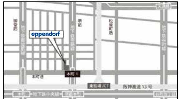
大阪会場 周辺地図

地下鉄堺筋線・中央線「堺筋本町駅」17番出口すぐ、地下鉄御堂筋線「本町駅」7番、3番出口徒歩7分。14階にお越しください。